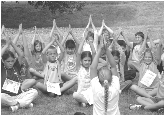
A sportnap résztvevői