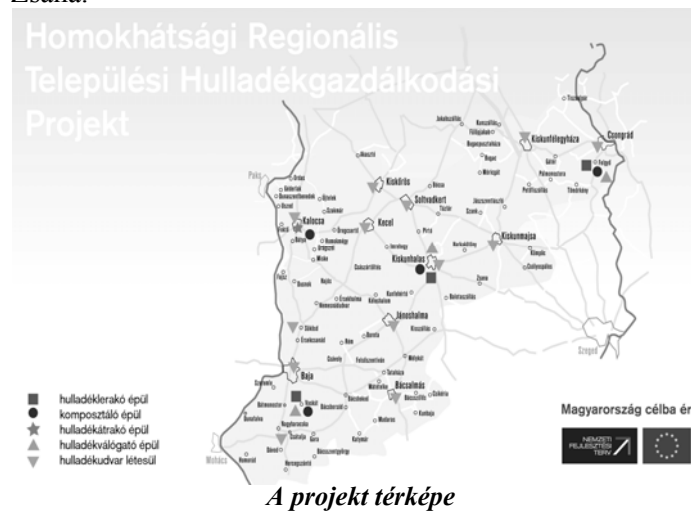
A projekt térképe

Öregcsertő, Pálmonostora, Petőfiszállás, Pirtó, Rém, Soltvadkert, Sükösd, Szakmár, Szank, Szeremle, Tataháza, Tázlár, Tiszaalpár, Tömörkény, Újtelek, Uszód, Vaskút, Zsana.