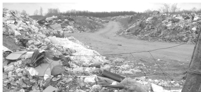
a jelenlegi helyzetről