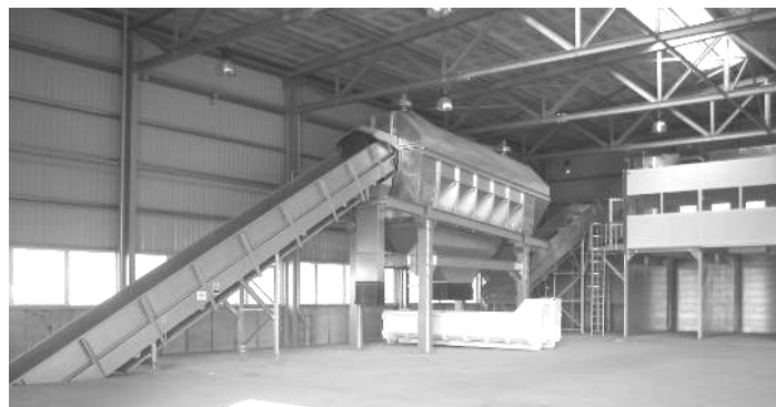
egy már kész, korszerű hulladékkezelő központ