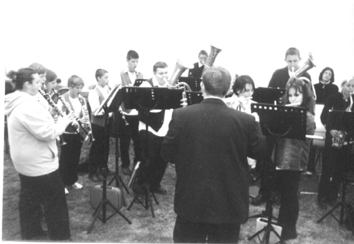
A vaskúti Művészeti Iskola fúvószenekara