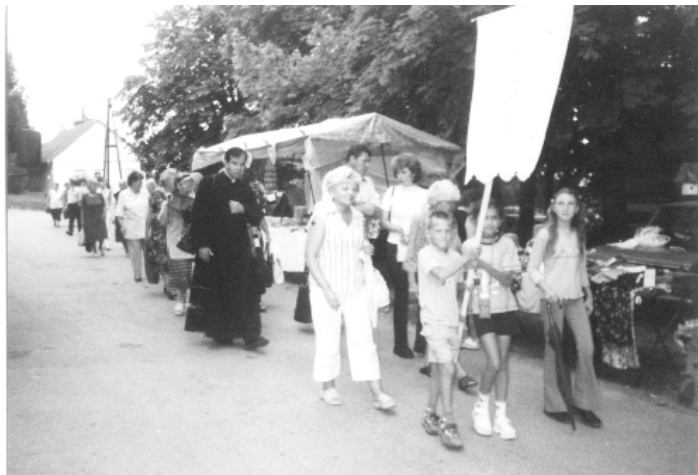
A kép Máriagyűdön készült

A 2003/2004-es tanévben is ingyenesen juthattak német tankönyvekhez az általános iskolás tanulók. 164 gyerek részére 189.132 Ft összegben vásároltunk nyelvkönyveket.