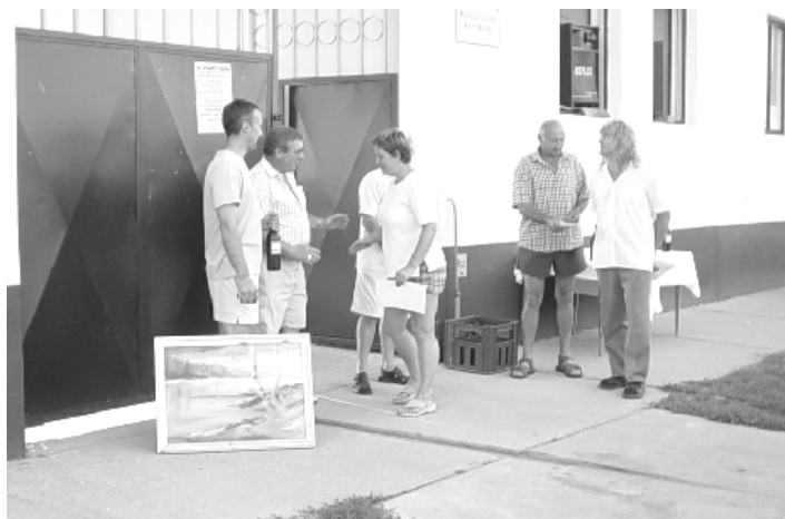
A zsűri átadja az első helyezettnek járó díjat.