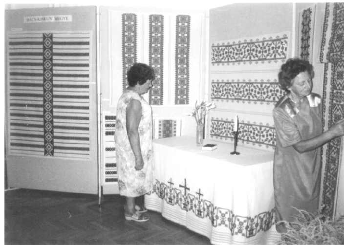
A kép a kiállításon készült

Augusztus 13-17-ig volt megtekinthető a szegedi Juhász Gyula Művelődési Központban a Regionális Népi Dísztőművészeti Kiállítás , amelyre Bács-Kiskun, Békés, Csongrád megye szakkörei vihették el munkáikat.